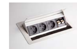
3 Steckdosen, 2 Netzwerkbuchsen VELDATA 1

VELDATA 1/VELDOSE 1: nur außermittig möglich VELKL30/VELKL31 (siehe unter Zubehör): mittig möglich