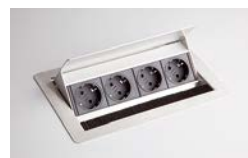
4 Steckdosen ELDOSE 1