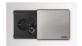
1x Steckdose, 1x USB, 1x RJ45 VELDO80

VELDATA 1/VELDOSE 1: nur außermittig möglich VELKL30/VELKL31 (siehe unter Zubehör): mittig möglich