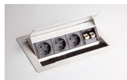
3 Steckdosen, 2 Netzwerkbuchsen VELDATA 1

4 Steckdosen oder 3 Steckdosen + 2 Datenbuchsen Bitte immer Position im Tisch angeben!