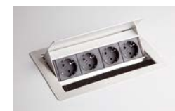
4 Steckdosen VELDOSE 1