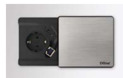
1x Steckdose, 1x USB, 1x RJ45 VELDO80

Kabelklappe VELKL31 (ohne Elektrifizierung) finden Sie unter Zubehör